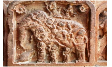
জোড়বাংলা মন্দির, বিষ্ণুপুর

বিষ্ণুপুরের জোড় বাংলা মন্দিরের অলংকরণেও পৌরাণিক কাহিনীও বাদ পড়েনি। এর মধ্যে উল্লেখযোগ্য পৌরাণিক ঘটনাগুলি হল - রামায়ণের কাহিনীর মধ্যে রয়েছে, অন্ধমুণির জল ভরার দৃশ্য, দশরথ কর্তৃক হত্যা, দশরথকে অভিষেকের দৃশ্য, দশরথের তিন রাণীর পায়ের খাওয়ার দৃশ্য, দশরথের পুত্রদের জন্ম, অস্ত্র শিক্ষা, হরধনু ভঙ্গ, রামের সাথে সীতার বিবাহ, হনুমানের সূর্য ভক্ষণ, বালী-সুগ্রীবের যুদ্ধ এবং পেছন থেকে রামের তীর মারার দৃশ্য, বালী রাবণকে সমুদ্রে চোবাচ্ছে তার দৃশ্য ফলক; এছাড়া রয়েছে সেতু বন্ধনের দৃশ্য, রাম-রাবণের যুদ্ধ, কুম্ভকর্ণের সাথে লক্ষ্মণের যুদ্ধ, বানরসেনাদের সঙ্গে রাক্ষসসেনাদের যুদ্ধ প্রভৃতি। মহাভারতের কাহিনীর মধ্যে জোড় বাংলা মন্দিরে স্থান করে নিয়েছে ভীমের গদা যুদ্ধের দৃশ্য, কুরুক্ষেত্রের যুদ্ধে শিখণ্ডিকে সামনে রেখে অর্জুন এবং ভীষ্মের যুদ্ধ প্রভৃতি। জোড় বাংলা মন্দিরের প্রতিষ্ঠা ফলকের নীচে রয়েছে কৃষ্ণ বলরামের ফলক (চিত্র নং ৭)।