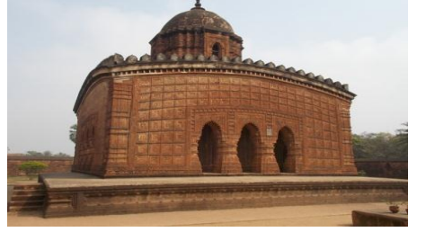
চিত্র নং ৪, একরত্ন মন্দির, বিষ্ণুপুর

একরত্ন: মল্লরাজ রাজা দুর্জন সিংহ ১৬৯৪ সালে এই একরত্ন মন্দিরটি নির্মাণ করেন (চিত্র নং ৪)। এই মন্দিরের উপাস্য দেবতা মদনমোহন। এই দেবালয়টি দক্ষিণমুখী। এই মন্দিরটির উচ্চতা প্রায় ৩৫ ফুট, আর দৈর্ঘ্য প্রায় ৪০'১০''। সাড়ে চার ফুট উচ্চতায় মাকড়া পাথরের ভিত্তি ভূমির অপর স্থাপিত। পূর্ব, পশ্চিম ও দক্ষিণ দিকে ত্রি-খিলান যুক্ত দালান রয়েছে; এই মন্দিরের দক্ষিণদিকে রয়েছে ভোগগৃহ, যার দৈর্ঘ্য ৪৬ ফুট। বর্তমানে এই ভোগগৃহটির অনেকখানি ছাদ ধসে পড়েছে। এই মন্দিরটি ত্রিখিলান যুক্ত টেরাকোটার অলংকরণে সজ্জিত। এত বড়ো ইঁটের দোচালা সৌধ শুধু বাঁকুড়া নয়, সারা রাঢ়বঙ্গে আর কোথাও দেখা যায় না।