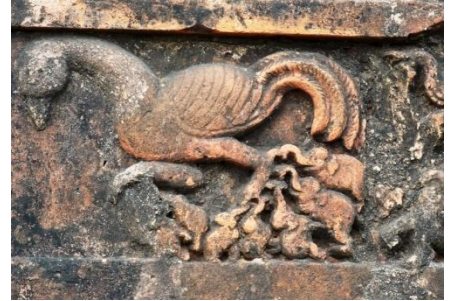
চিত্র নং ৮, টেরাকোটা ফলক: অস্ত্রিচ পাখি, পঞ্চরত্ন মন্দির, বিষ্ণুপুর

ঘ) জ্যামিতিক নকশা কেন্দ্রিক যেসব মোটিফ এখানকার টেরাকোটা মন্দির স্থাপত্যে রয়েছে সেগুলি হল - ত্রিভূজ, চতুর্ভূজ, সরলরেখা, দাড়ি, বৃত্ত, অর্ধবৃত্ত, আয়তক্ষেত্র ইত্যাদি।