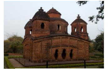
চিত্র নং ২, পঞ্চরত্ন মন্দির, বিষ্ণুপুর