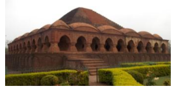
চিত্র নং ১, রাসমঞ্জ, বিষ্ণুপুর

৩. বিষ্ণুপুরের টেরাকোটা মন্দির স্থাপত্যের গঠন: গবেষক ও পুরাতত্ত্ববিদরা বাঁকুড়া জেলার বিষ্ণুপুর শহরটিকে ‘মন্দির নগরী’ বলে উল্লেখ করেছেন। বিষ্ণুপুরে মল্লরাজাদের রাজত্বকালে প্রচুর টেরাকোটা, মাকড়া পাথর ও ঝামা পাথরের মন্দির নির্মিত হয়েছিল। কালের-গতিতে এবং রক্ষণাবেক্ষণের অভাবে এই অপূর্ব কীর্তি গাঁথা আজ অনেকটা ধ্বংস হয়ে গেছে। বর্তমানে টেরাকোটা অলংকৃত মন্দিরের সংখ্যা বিষ্ণুপুরে চারটি। মন্দিরগুলি যেন অসহায়ের মতো হাত ধরাধরি করে দাঁড়িয়ে ধ্বংসের শেষ আঘাত থেকে রক্ষা পেতে ছাইছে। তবে আশার কথা ভারতীয় পুরাতাত্ত্বিক সর্বক্ষণ (ASI) বিভাগের সহায়তায় মন্দিরগুলির সংরক্ষণ হয়েছে এবং এই মন্দিরগুলি National Heritage এর মর্যাদা পেয়েছে এবং World Heritage site হিসাবে মর্যাদা প্রদানের জন্য আবেদন করা হয়েছে বলে জানা যায়।