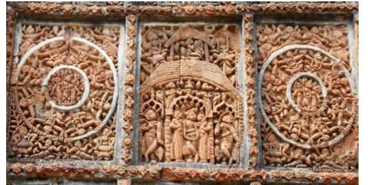
চিত্র নং ৫, টেরাকোটা ফলক: রাসচক্র ও কৃষ্ণলীলা,

সপ্তদশ শতকের মন্দিরচর্চায় বিষ্ণুপুরের মন্দিরনির্মাণকে কেন্দ্র করে বৈষ্ণবীয় রসশাস্ত্র অনুসরণের রীতি অবশ্যই ছিল। মল্লরাজারা মন্দিরের ভেতরে এবং বাইরে তাঁদের ধর্মীয় নিষ্ঠার চিত্র রেখে গিয়েছেন।