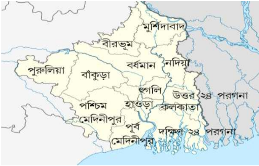
মানচিত্রঃ দক্ষিণ বঙ্গ

এই ১৩ টি জেলার মধ্যে কিছু জেলা আবার খুবই বন্যাপ্রবন। এদের মধ্যে পূর্ব মেদিনীপুরের দুটি ব্লক তমলুক, পাঁশকুড়া, পশ্চিম মেদিনীপুরের ২১ টি ব্লক, হাওড়ার তিনটি ব্লক আমতা ১, আমতা ২, উদয়নারায়ানপুর, হুগলীর দুটি ব্লক খানকুল, জঙ্গিপাড়া, এছাড়া উত্তর ও দক্ষিণ ২৪ পরগনার বিভিন্ন ব্লক বন্যা কবলিত। এখানে ভাগিরথী-হুগলী অববাহিকা, সুবর্ণরেখা অববাহিকা, সুন্দরবন অববাহিকা অবস্থিত। ভাগিরথী-হুগলী নদী অববাহিকার প্রধান নদী গুলি হল পাগলা, দ্বারকা, ব্রাহ্মনি, অজয়, ময়ূরাস্কী, বাবলা, দামোদর, শিলাবতি, প্রভৃতি। এই নদী অববাহিকার আয়তন ৪৭,৯৩৬ বর্গ কি.মি। সুন্দরবন অববাহিকার প্রধান নদী গুলি হল ইছামতি, বিদ্যাধরি। আয়তন ৫৭০৬ বর্গ কি.মি। সুবর্ণরেখা অববাহিকার প্রধান নদী সুবর্ণরেখা। এই সব নদী অববাহিকার নদী গুলির জলের হ্রাস বৃদ্ধির সঙ্গে বন্যা হওয়া বা না হওয়ার প্রত্যক্ষ যোগ আছে। এর সাথে অন্যান্য কারণ গুলি হল -