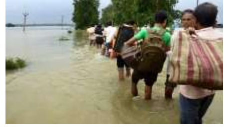
চিত্রঃ বন্যার ফলে আশ্রয়হীন মানুষ